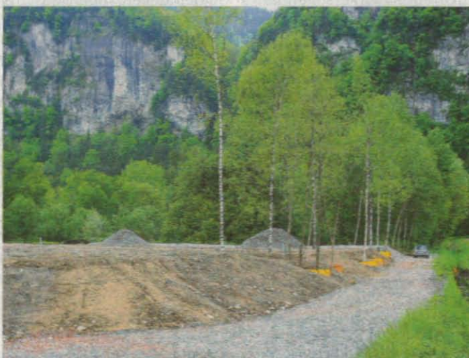
Rund 10.000 Kubikmeter Bauschutt belasten den Boden den Sommer über, damit die Torf-haltige Erde sich setzt.