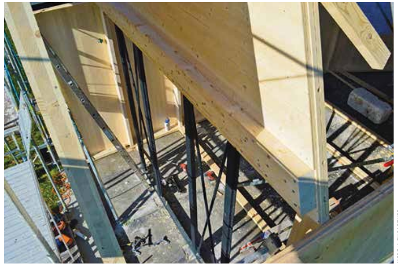
MERZ KLEY PARTNER

▶ Die Aussteifung ließ sich im Eingangsbereich über das „Zugband“ (Holzbalken an der Unterkante der Giebelscheibe) und den Portalrahmen bewerkstelligen