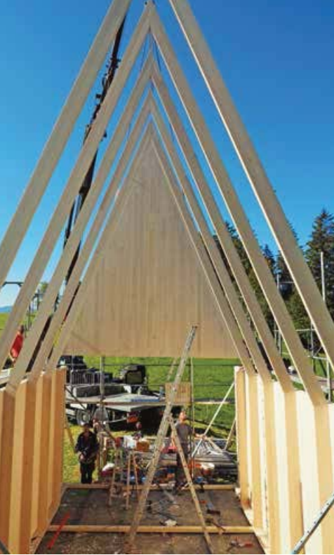
BERNARDO BADER ARCHITECTEN

◀ Die Spanten dienen ausschließlich der Beul- und Biegestabilität