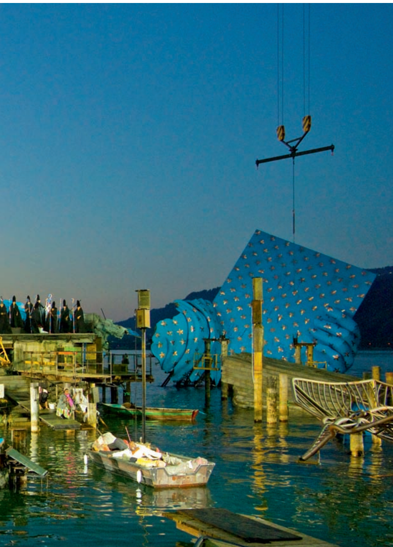
Füße und Buch zum Bühnenbild Aida, Bregenzer Festspiele